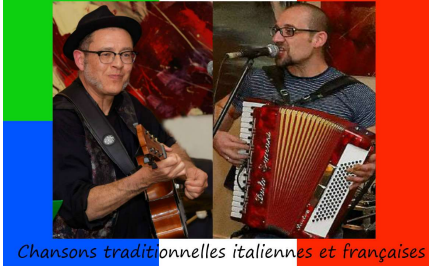
Chansons traditionnelles italiennes et françaises